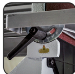
Table inclinable à 45° 45° Tafel beneden verstelbaar