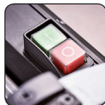
Moteur asynchrone Asynchronous motor