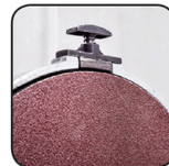
Frein du disque Remschijf