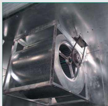
Ventilateur centrifuge double ouïes

CABINES OUVERTES type industrie pour l'application des apprêts, peinture et vernis.