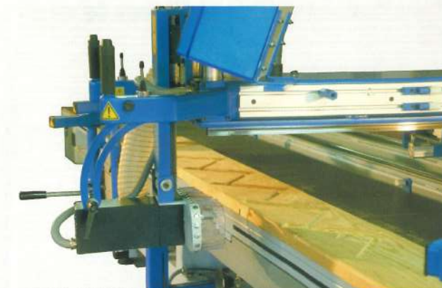
Moteur inclinable de 0° à 90° pour forer, rainurer ... Inclinable motor from 0° to 90° for drilling, grooving ... Kantelbaar motor van 0° tot 90° voor boren, groeven ... Schwenkbarer Fräsaggregat von 0° bis 90° zum Bohren, Nuten