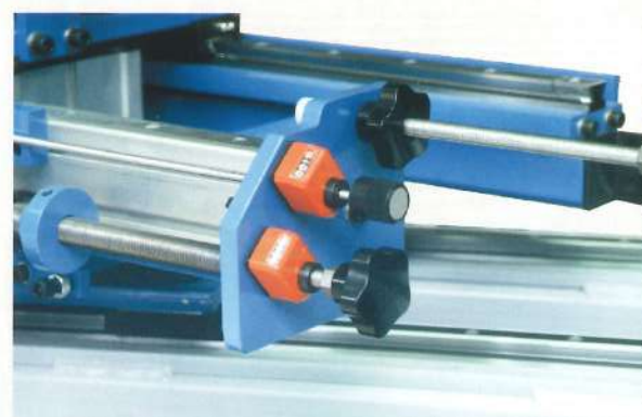
Réglage de l'épaisseur de marche au 1/10 mm Setting for thickness to 1/10 mm Dikte instelling van de trede op 1/10 mm Einstellung der Stufenstärke 1/10 mm