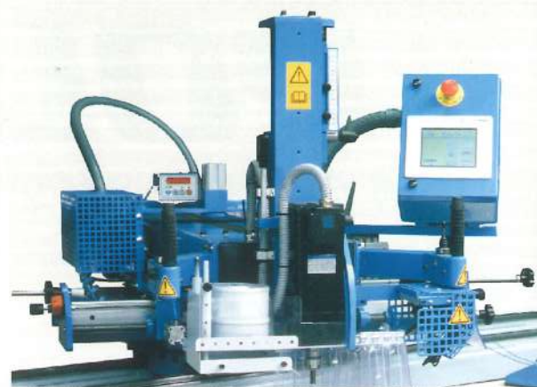
Ecran " Touchscreen " pour la commande de la machine Touchscreen display for lengthwise positioning of carriage Touchscreen scherm voor de besturing van het machine Touchscreen display für der Maschine Steuerung