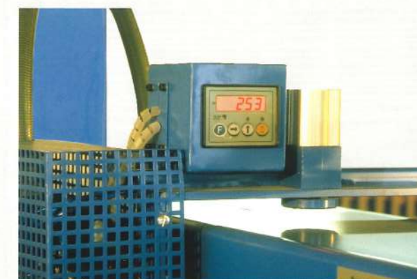
Affichage digital de l'angle des marches dans le limon Digital display of the stair position in the string Digitale hoek instelling voor de treden in de trapboom Winkeleinstellung mit digitaler Anzeige