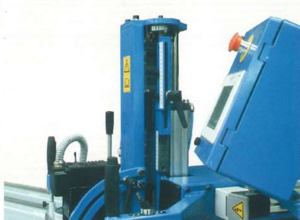
Profondeur automatique sur barillets Automatic depth setting Automatische diepte instelling automatische Tiefeneinstellung über Skala